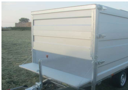
MODULA - Dubbele rij: Neerklapbaar voorbord, uitschuifbare opzetborden (H=2x50cm)