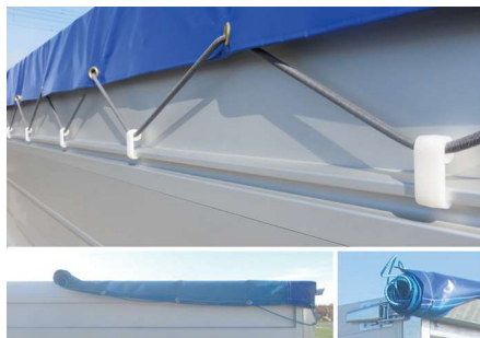
Versterkt zeil/gaasnet met oprolhulp en opbergplaats (2)