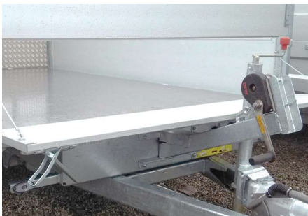
Manuele lier met steun op voorzijde (1)