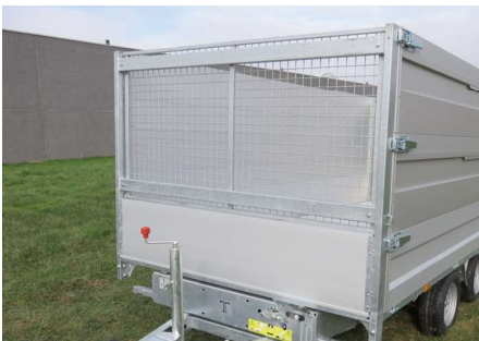
Loofrek op standaard voorrek (H = 100cm)