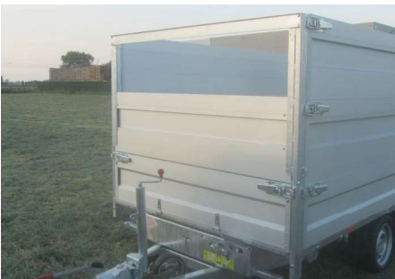
MODULA - Enkele rij: Neerklapbaar voorbord, uitschuifbaar opzetbord (H=50cm)