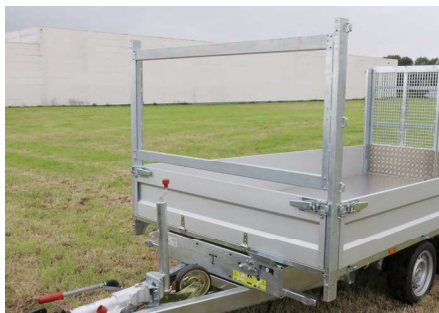
MODULA - Basis: Neerklapbaar voorbord, voorrek met verstelbare liggers