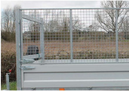
Loofrek (H = 100cm)