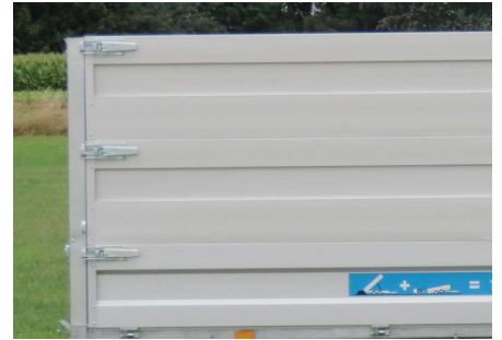
Dubbele rij opzetborden (H = 2x50cm)