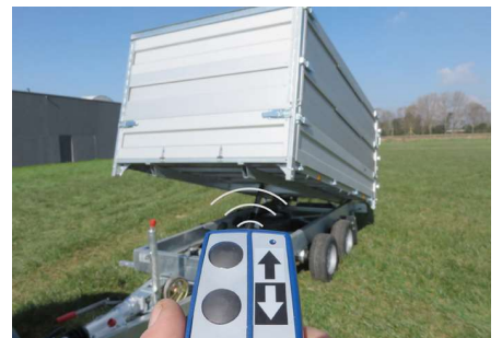
Afstandbediening voor kippen en kantelen.

(1) Enkel leverbaar in combinatie met optie voorkant MODULA