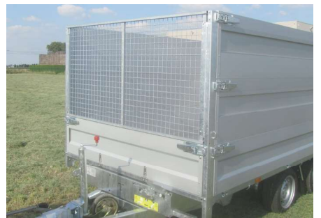
MODULA - Loofrek: Neerklapbaar voorbord, demonteerbaar loofrek (H=100cm)