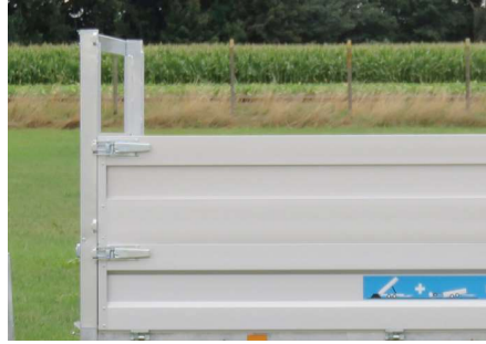
Enkele rij opzetborden (H = 50cm)